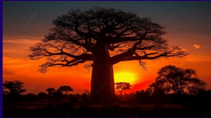
Der Heilige Baobab Baum