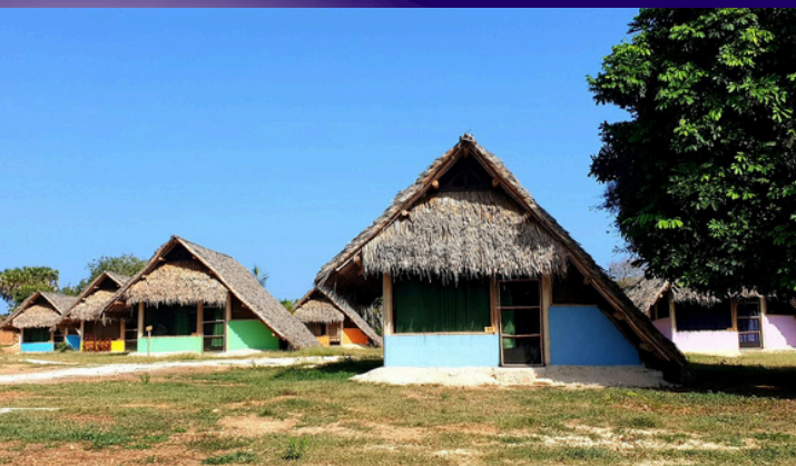
Dein afrikanisches Häuschen