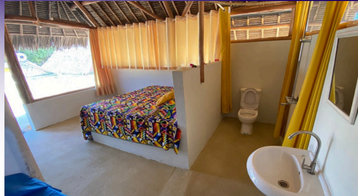
Dein privates Zuhause