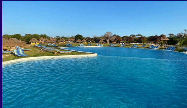
Der blitzsaubere Swimming Pool