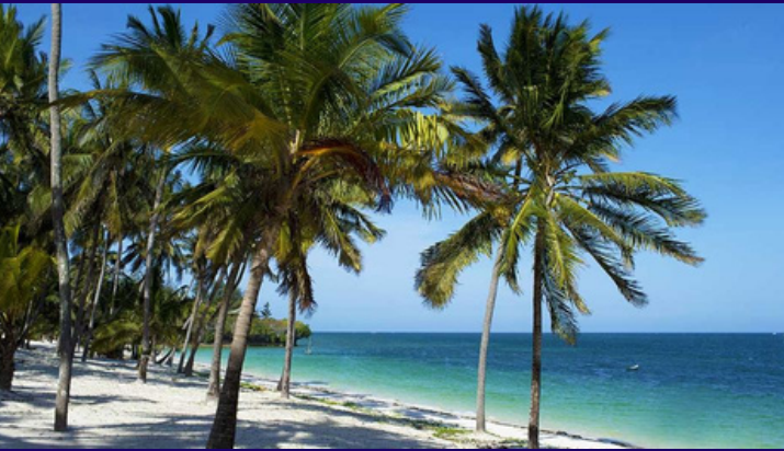
Am wunderbaren Indischen Ozean